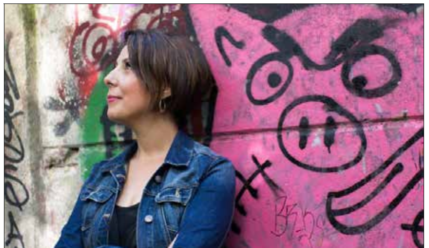
L'enseignante écrit aussi des chroniques sur son blog et sur sa page Facebook pour mettre en valeur des personnalités issues de la diversité afin de "mettre en lumière cette majorité silencieuse".