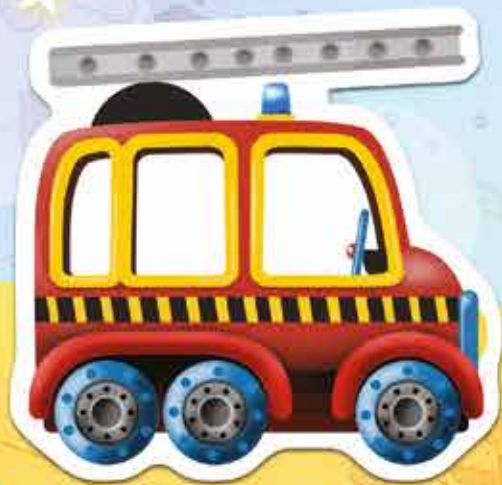
un camion de pompiers