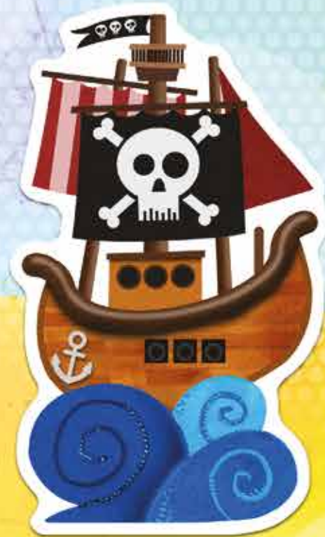
un bateau de pirates