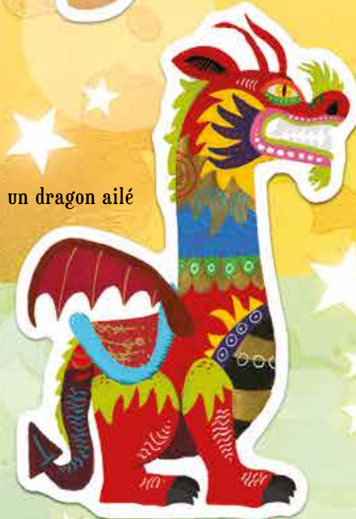
un dragon ailé