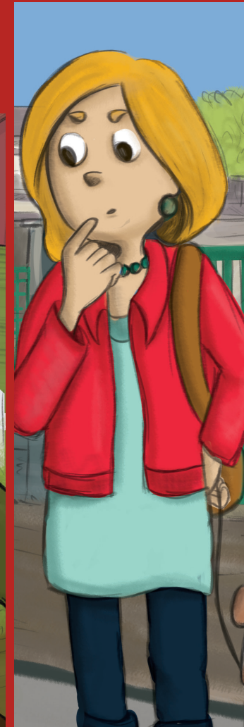
LA DAME DE L'ÉCOLE